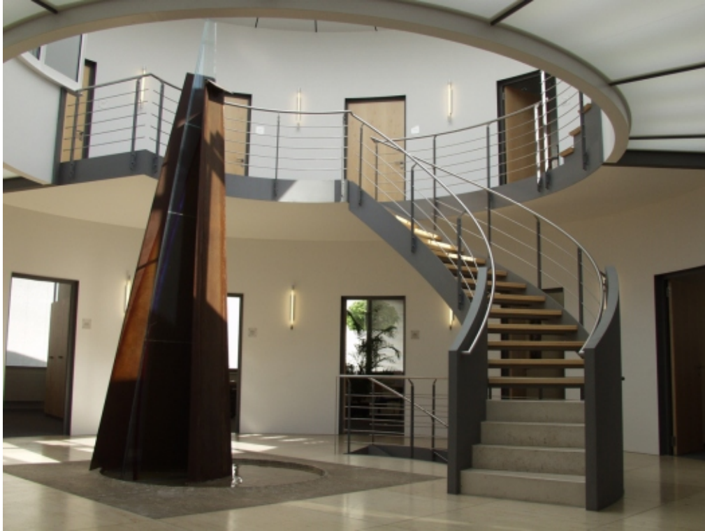
Innentreppe und Geländer