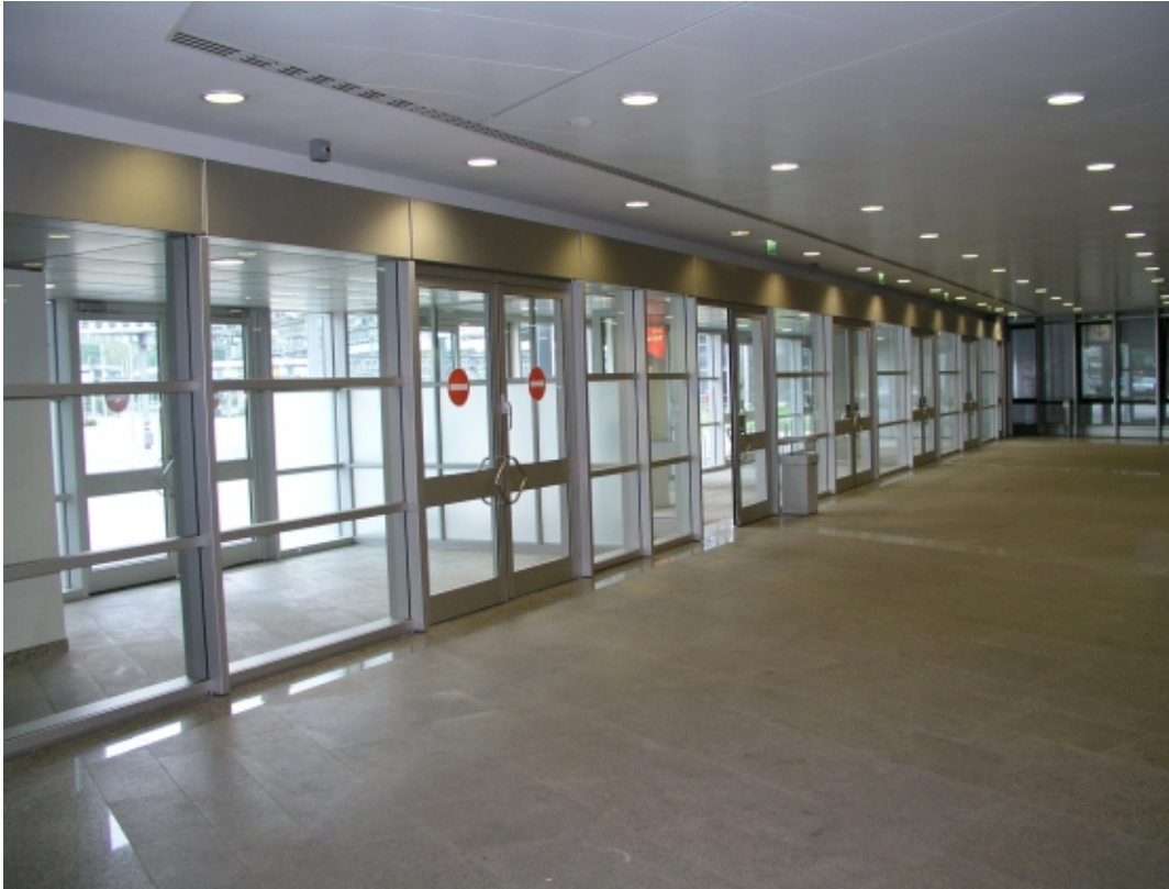
Windfanganlage Eingang Mitte